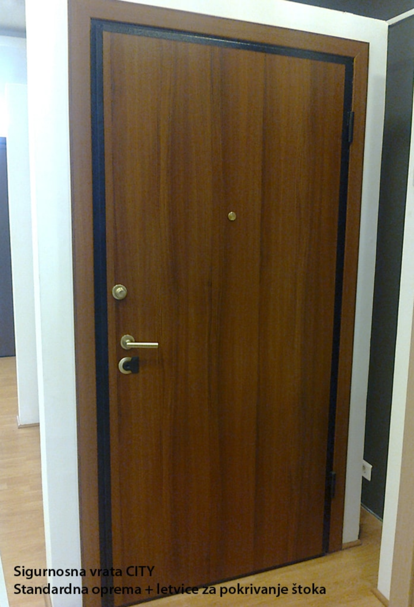
Sigurnosna vrata CITY Standardna oprema + letvice za pokrivanje štoka